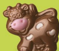
Praliné croustillant aux éclats de crêpe dentelle