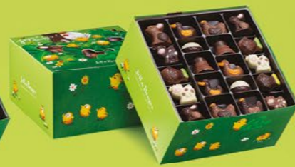
LE BALLOTIN DE 750 G NET 60 CHOCOLATS ASSORTIS